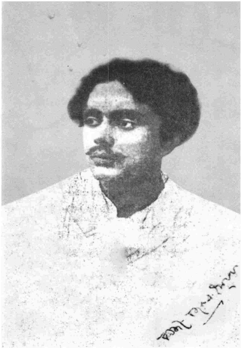
ধুমকেতু পত্রিকায় প্রকাশিত নজরুলের স্বাক্ষরযুক্ত ছবি