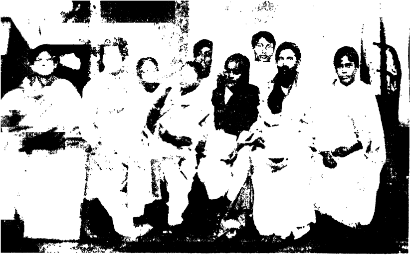
লেদের অনেকগুলি হাতে-লেখা পত্রিকা ছিল