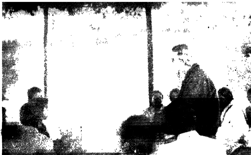
১ প্রশ্ন করিয়া করিয়া বালকদের মুখ দিয়া ঠিক শব্দটি বাহির করিয়া লইভেন