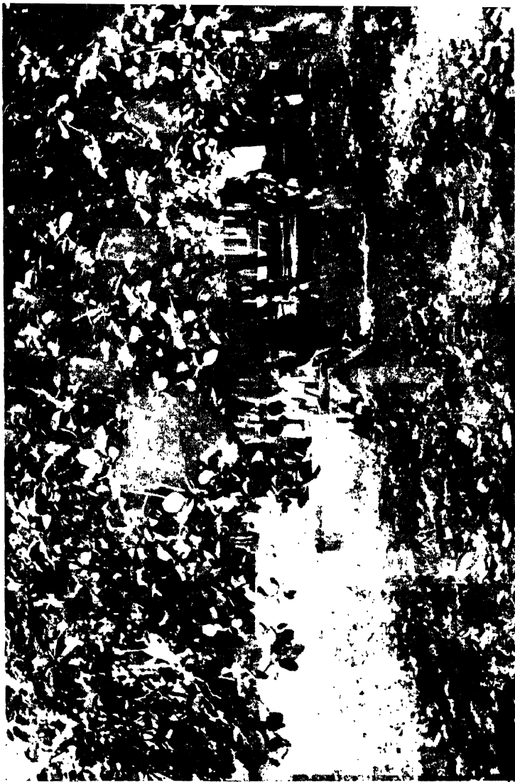
ঘরের বাহিরে গাছে তলায় ক্রাস বসিত