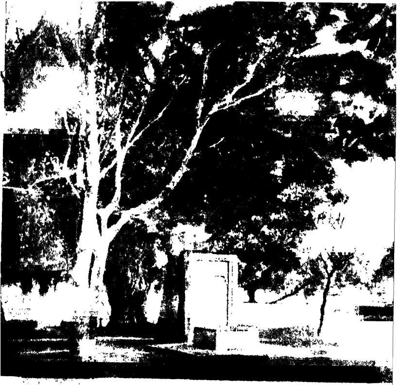
ছাত্তিমতলার তিনি ধ্যানের আসন পাড়িলেন