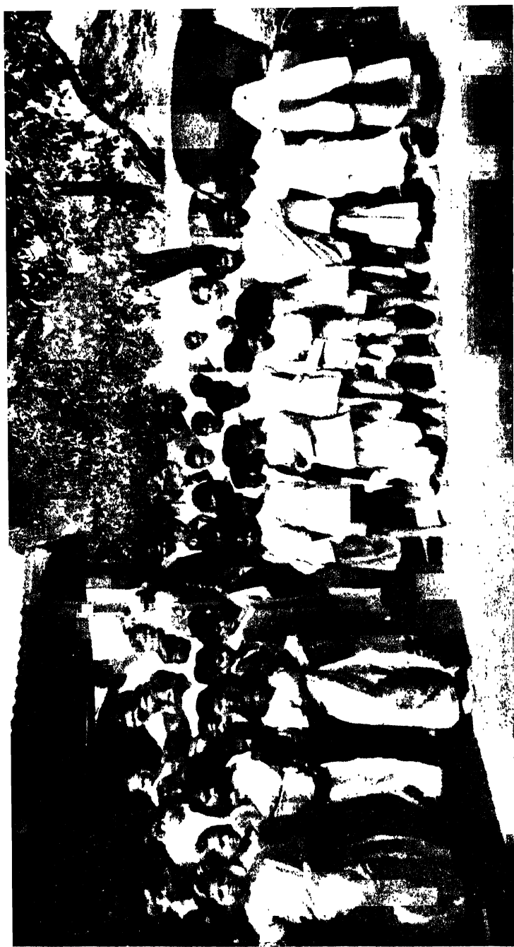
ছেলেদের নানারকমের ছোটো-বড়ো সভায় তিনি নিয়মিত আসিতেন