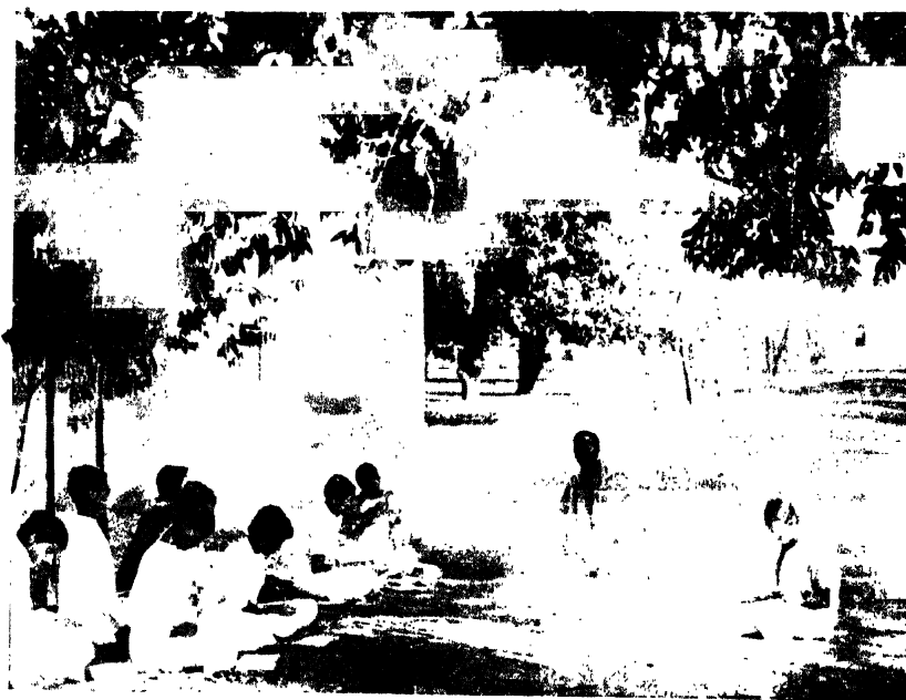
অগদানন্দবাবুর ক্লাসের আয়ুর্গা ছিল নাট্যধর্মের কাছে ফটকটার তলায়...