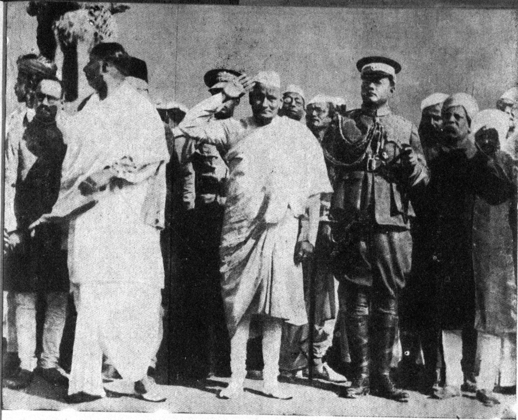
কালকাতা কংগ্রেস : ১৯২৮ যতীন্দ্রমোহন সেনগুপ্ত, মতিলাল নেহেরু, সদ্ভাষচন্দ্র